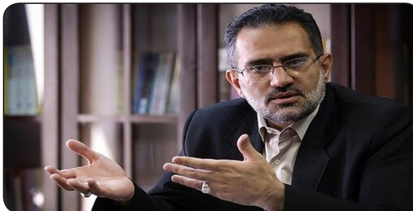
بارزی از اقتدار ایران در عرصه بین الملل است.